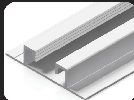
Perfil Suporte do Módulo Plano