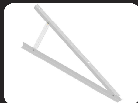
Triângulo Vertical / Horizontal