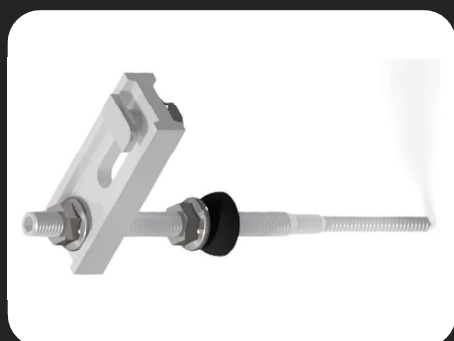
Parafuso Prisioneiro Madeira