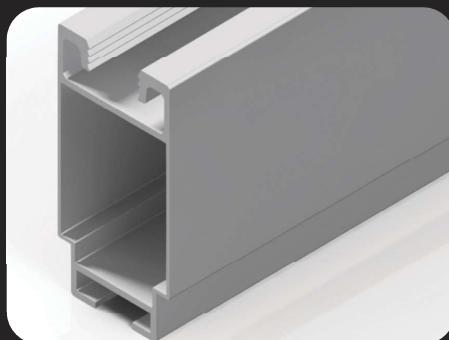
Perfil Suporte do Módulo Reforçado