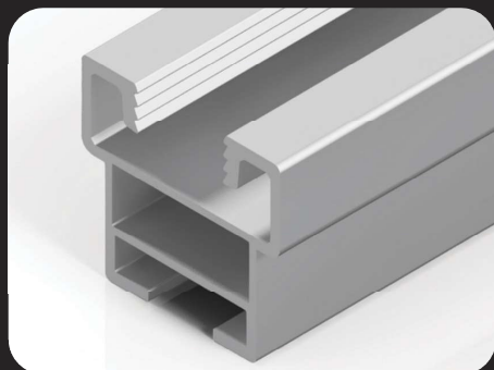
Perfil Suporte do Módulo