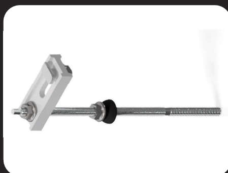
Parafuso Prisioneiro Metálico