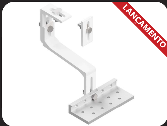
Gancho de Fixação